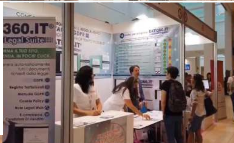
Alcune foto dello staff alle fiere di settore, eventi formativi, convegni.